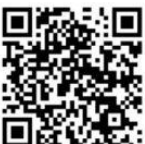
شكل رقم / ٢